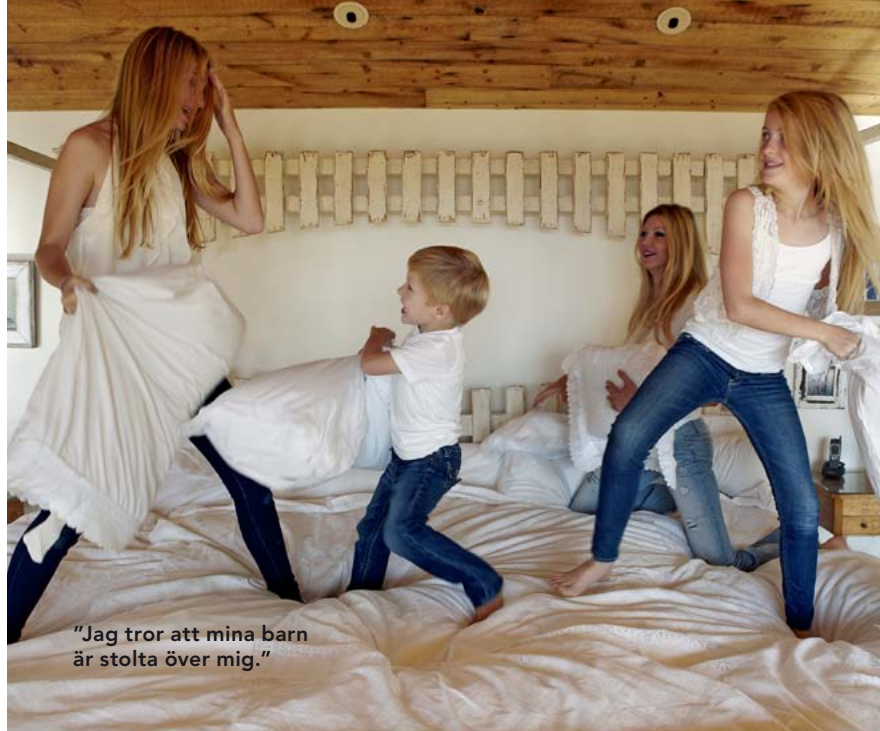
”Jag tror att mina barn är stolta över mig.”