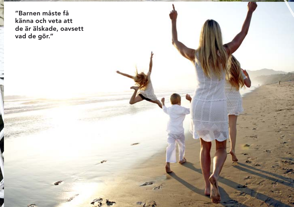
”Barnen måste få känna och veta att de är älskade, oavsett vad de gör.”