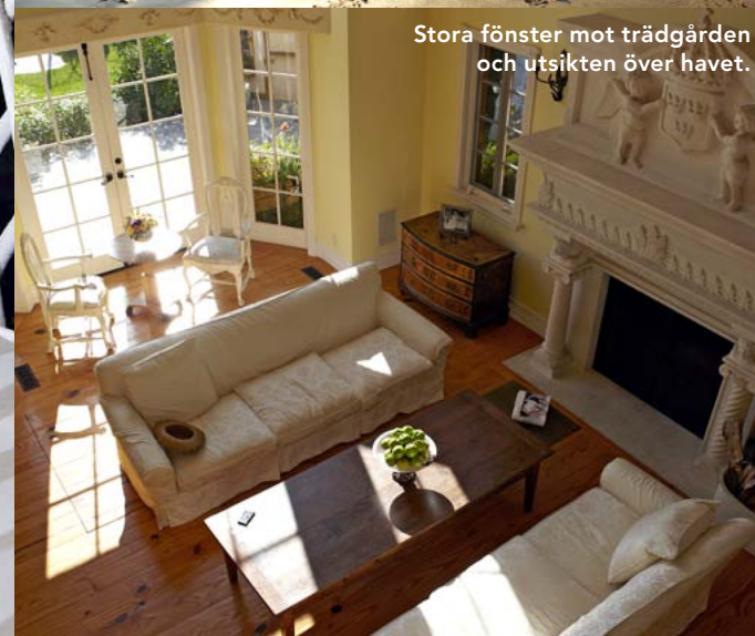
Stora fönster mot trädgården och utsikten över havet.